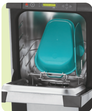
収納例：差込用便器