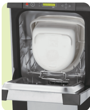
収納例：バケツ(高さ25cm)