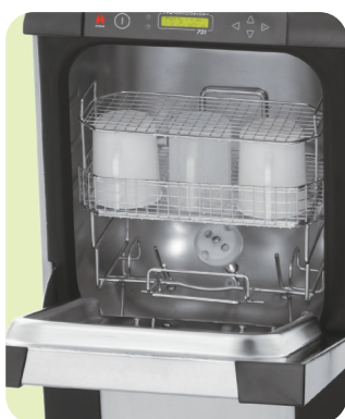
収納例：採尿計量カップ(3個)