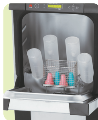
収納例：シャワーボトル(4本)