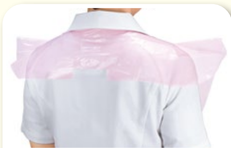
背中部分までカバー