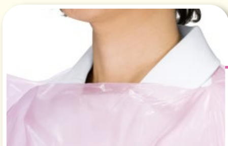
首周りが大きく開かずしっかり防護