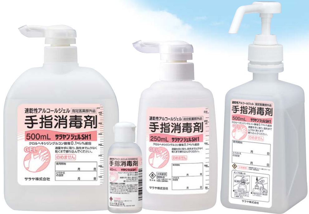
500mL 扁平 ポンプ付 (減容ボトル)