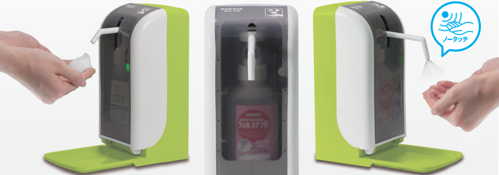
ノータッチ式ディスペンサー GUD-500-PHJ

従来のノータッチ機能そのまま、軽量、コンパクト、省スペース設計で設置場所のバリエーションが増えました。