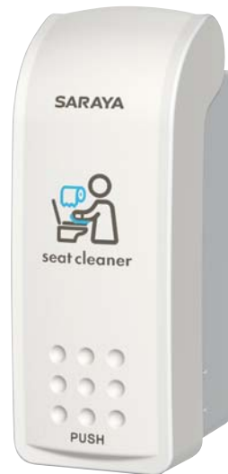
MD-300B-PHJ 便座クリーナー用