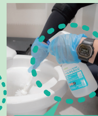
トイレまもるさん