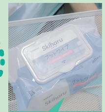
スキナルフットワイプ