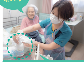
スキナル 拭き取り泡ボディソープ