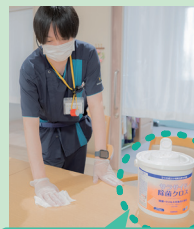
サラサイド除菌クロス