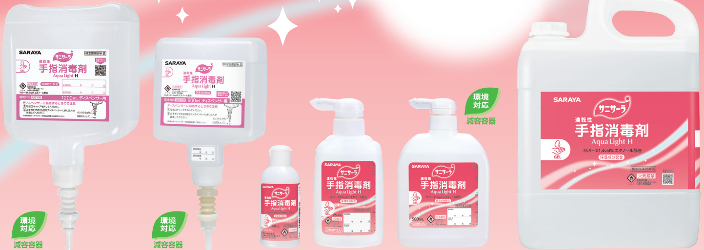
1200mLディスペンサー用