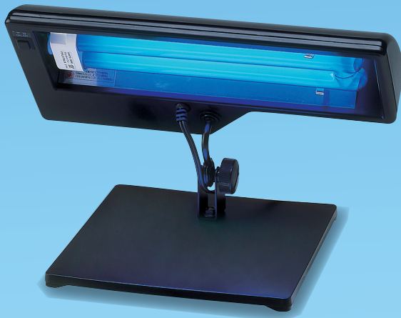
スタンド型手洗いチェッカー本体 (1台)