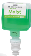
600mL ディスペンサー用