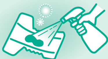
使用済みオムツに