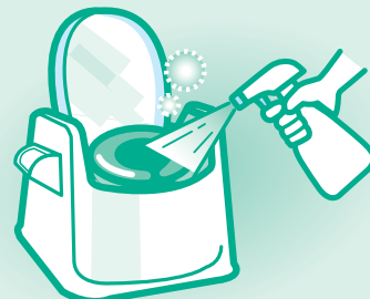
ポータブルトイレに