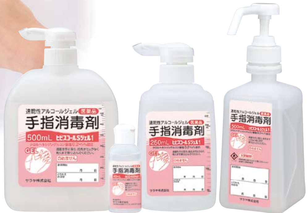
500mL 扁平 ポンプ付 (減容ボトル)