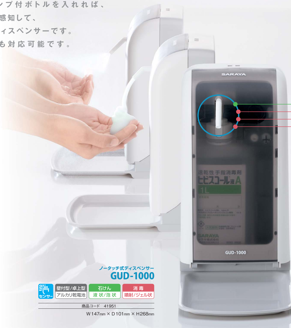
ノータッチ式ディスペンサー GUD-1000

3 どこでも設置が可能 据え置きでも壁付けでも対応でき、乾電池式なのでコンセントのないところでも設置可能です。