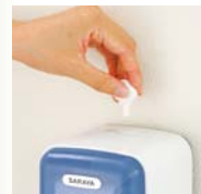
鍵でいたずら防止