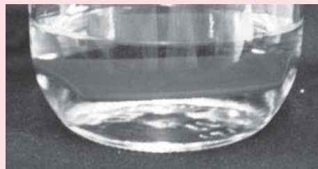
図3 フェノール樹脂テストピースの溶液の変化