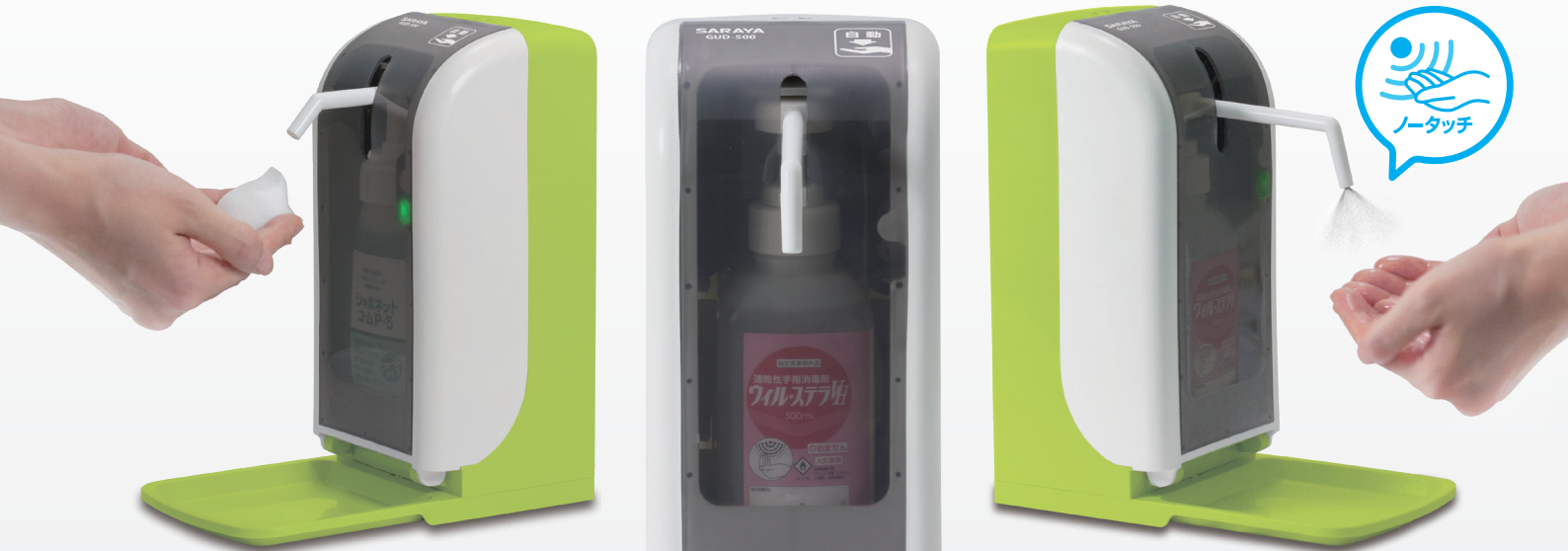
ノータッチ式ディスペンサー GUD-500-PHJ

センサー感知、ノータッチで石けん液にも消毒液にも対応。 従来のノータッチ機能そのまま、軽量、コンパクト、省スペース設計で設置場所のバリエーションが増えました。